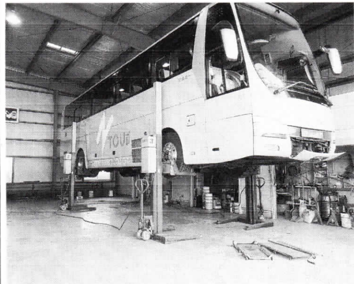
大型車用移動式リフト

導入した。バスやトラックの整備で天井に上って行う作業時に「安全帯をつけたまま上下左右に移動が可能なため、作業性を失わずに安全性を確保できるようになった」(川口社長)という。重量物の上げ下げを簡単に行うことができる「ホイスト」や、大型車両の移動式リフトも導入している。今夏は暑さ対策として、新たな設備の導入を検討中だ。こうした設備投資により作業の省力化と安全確保を行っている。